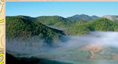
La ruta del Corral de los Lobos discurre por valles y montículos alomados densamente cubiertos de bosque de rebollo.