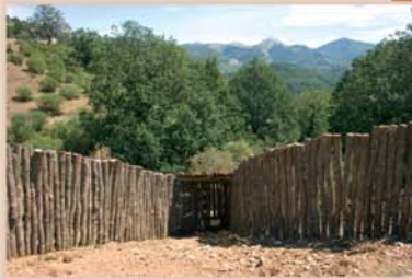
En el collado del Corral de los Lobos se puede ver un corcho como los que se utilizaban antaño para la captura del lobo. Aunque su uso en la zona, a juzgar por el topónimo del collado, se debe remontar a un tiempo muy remoto, este enclave siempre fue un lugar estratégico donde confluían los batidores de Tejerina y Prioro cuando se organizaban batidas colectivas para tratar de sacar a los lobos del monte.