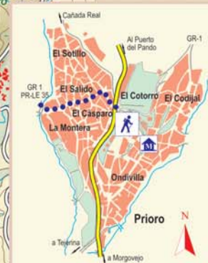
Prioro es un destacado jalón de la Cañada Real Leonesa Oriental. Por ello siempre ha estado muy vinculado a la trashumancia, como prueban el chozo levantado a la entrada del pueblo, muchas de las herramientas, utensilios o ropajes que se pueden ver en su museo etnográfico, o la tradición de la Fiesta de la Trashumancia, que se celebra el tercer fin de semana de junio como recibimiento a los rebaños de merinas.