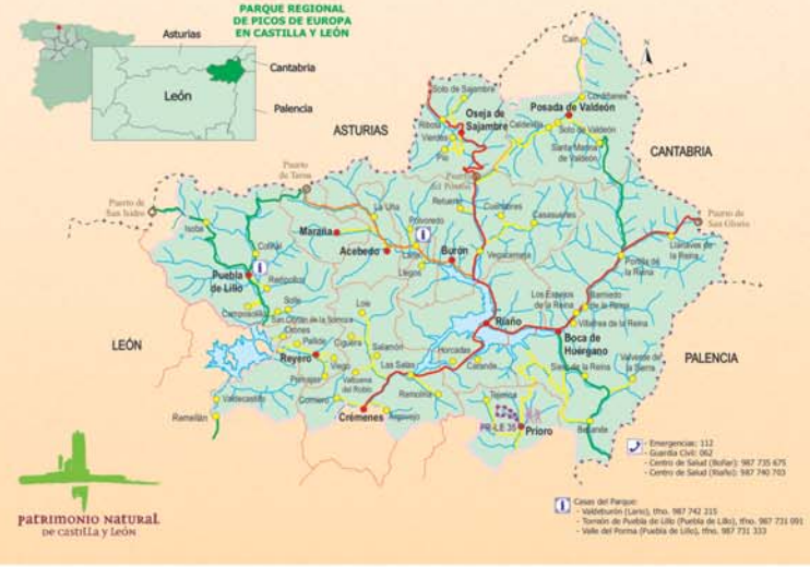
Patrimonio Natural de Castilla y León