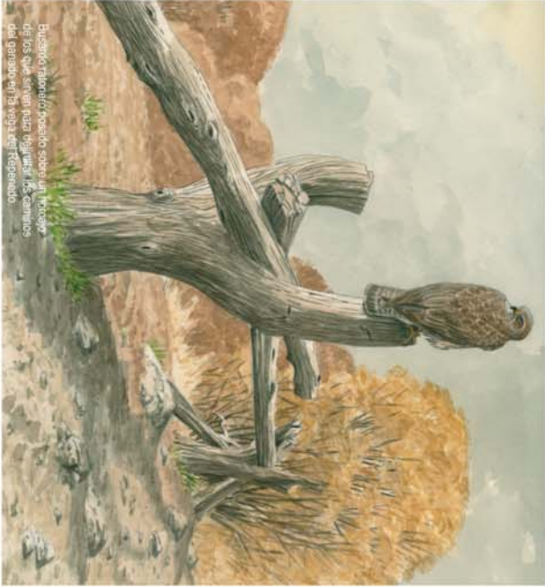
El antiguo Corral de Repenedo sobrevive en un rincón de los que sobreviven para vigilar a los caminos del ganado en la vega del Repenedo.

Desde las inmediaciones de la Iglesia de Prioro, iniciamos la marcha cruzando la carretera del Puerto del Pando y callejando por El Salido hacia la periferia del pueblo. Allí encontraremos un puente que salva el río Cea muy cerca de su confluencia con el Repenedo, un riachuelo secundario cuya frondosa cuenca vamos a recorrer en esta excursión. Para ello, inmediatamente después de cruzar el cauce del Cea, seguimos el camino de la derecha, señalizado con las marcas del GR 1. Enseguida se llega a una bifurcación, en la que tomamos el ramal de la izquierda para continuar avanzando por el margen del río hasta encontrar un nuevo desvío que nos permite cambiar de orilla. Abandonando el GR 1, comenzamos a ascender hacia el robledal que tapiza toda la umbra del valle, con rebollos altos y recios, cubiertos de líquenes. A la sombra del bosque, la ruta nos conduce a una nueva bifurcación, donde debemos elegir entre dos caminos que tienen el mismo destino. El de la derecha conduce por la vertiente septentrional de los Años de Puente Marín hasta el collado del Corral de los Lobos, mientras que el otro sube a doblar la divisoria de vertientes en el Collado Penidello para continuar hacia el Corral