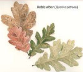
Roble albar ( Quercus petraea )