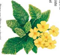
Primavera ( Primula vulgaris )

Utilizando esta segunda opción, mucho más entretenida y vistosa, terminamos por alcanzar de nuevo la divisoria al pie de un montículo coronado por grandes robles albares, donde los pastores levantaban antaño sus rediles; de hecho subiendo a este alto descubriremos una caseta de pastores bien arreglada. La ruta rodea el montículo para bajar al collado del Corral de los Lobos, donde se puede ver un chorro como los que se usaban antaño para la caza del lobo mediante batidas colectivas. En este enclave confluyen de nuevo el PR y el GR 1. En dirección a Tejerina, el GR conduce hasta una fuente cercana, pero nuestra ruta aprovecha el sendero de gran recorrido en sentido contrario, para regresar a Prioro por una pista que recorre el valle del río Repenedo desde su nacimiento hasta su confluencia con el Cea a las puertas del pueblo. En todo este trayecto apenas se encuentra algún camino, claramente secundario, que se aparta de nuestro recorrido. Tan solo existe una bifurcación más dudosa en el tramo llano de la vega del Repenedo, donde la ruta se decanta por el ramal de la derecha, que discurre pegado a los prados, si bien ambas opciones se juntan de nuevo un poco más adelante.