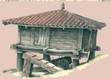
En Prioro se conserva un interesante conjunto de hórreos que poseen características muy particulares; así, la mayoría tienen paredes hechas a base de tablones horizontales y techo a cuatro aguas, aunque lo que más llama la atención es el "subidero", tallado en una única pieza de madera.

Las hojas profundamente lobuladas del rebollo se distinguen de las de otros robles porque presentan tanto el haz como el envés cubiertos por finos pelillos que les confieren un tacto aterciopelado.